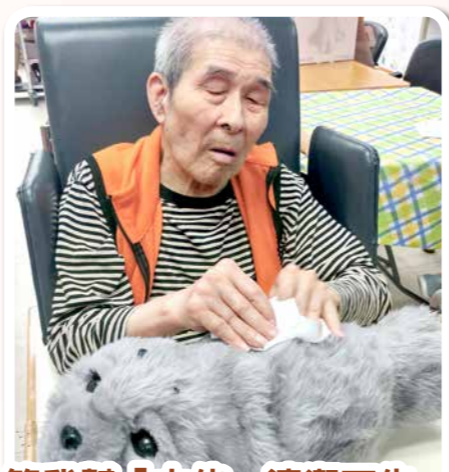
等我幫「大佬」清潔下先～

小海豹—『大佬』（又名《PARO》原名），被認為全世界最具有療癒效果的機器人，除視覺、聽覺、觸覺外，它也會隨著白天黑夜的變化，甚至還有學習能力。患有認知障礙症的長者與 PARO 朝夕相處後，有助逐漸敞開長者孤寂的心靈，改善憂鬱，同時也能提升患者的短期記憶能力，從尋昔日照顧幼童或寵物的溫馨回憶。