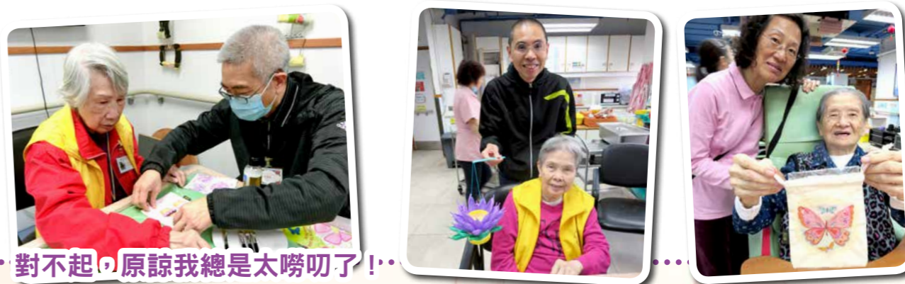
對不起，原諒我總是太嘮叨了！