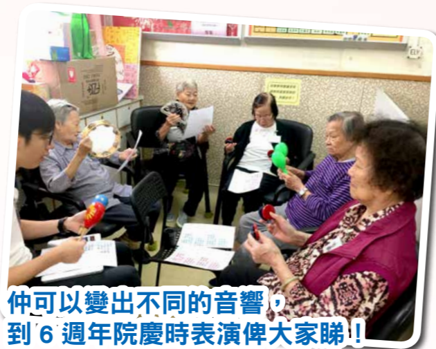
仲可以變出不同的音響，到6週年院慶時表演俾大家睇！！