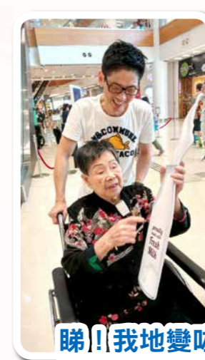
睇！！我地變咗牛奶同一盒雪糕出來！有邊個想試下新味道？