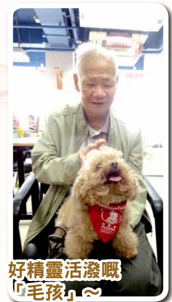
好精靈活潑嘅「毛孩」~