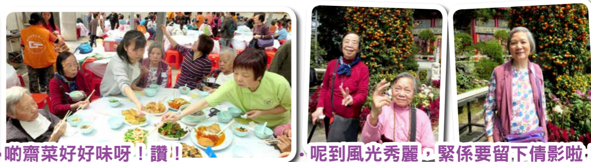
啲齋菜好好味呀！讚！！ 呢到風光秀麗，緊係要留下倩影啦！

老友記一同到「老地方」（雲泉仙館）懷緬人和事，重拾珍貴的回憶，向身邊人「道愛」。