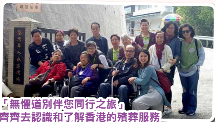
「無懼道別伴您同行之旅」 齊齊去認識和了解香港的殯葬服務

其實，不是只有面對死亡時才需要這四道人生，在我們的日常生活中，都要把握每一次「四道」的機會，對家人、對親人都要說出：「謝謝、對不起、我愛您、再見」，而這些看似簡單的言語，是對我們最珍貴的禮物。老友記，您今天做到了嗎？