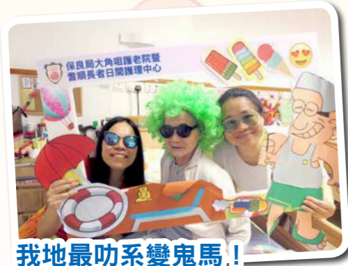
我地最叻系變鬼馬！