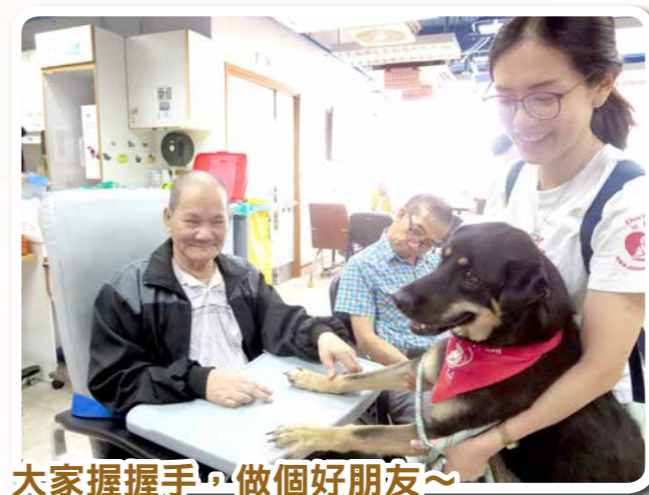
大家握握手，做個好朋友~