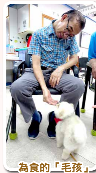
為食的「毛孩」，等伯伯請你食零食