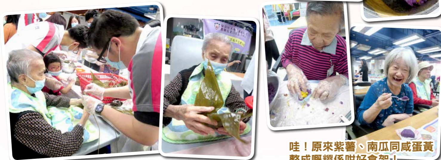
哇！原來紫薯、南瓜同咸蛋黃整成嘅糉係咁好食架！